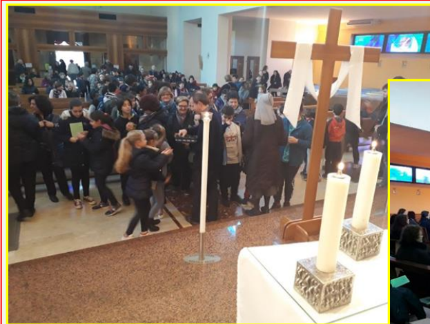
Via Crucis Martedì santo